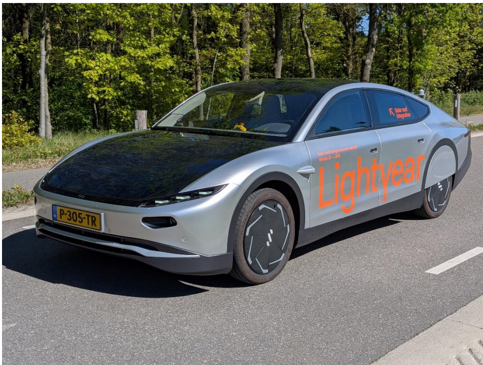
Abb. 2 PKW könnten in Mitteleuropa bis zu 55 Prozent ihres Energiebedarfs selbst erzeugen; in Südeuropa könnten es bis zu 80 Prozent sein.