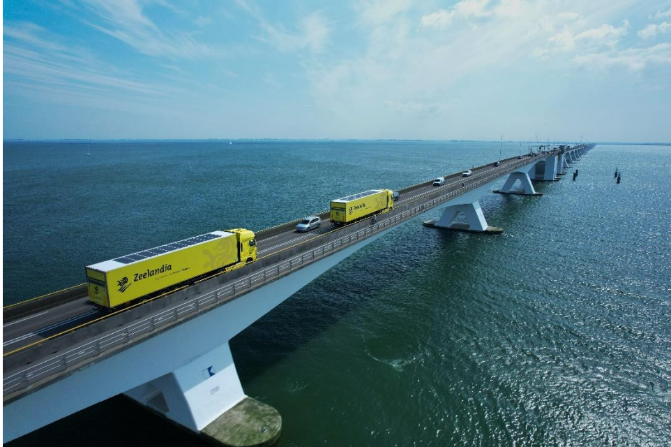
Abb. 1 Insbesondere Lieferwagen, Lkw und Anhänger verfügen über viel Dachfläche und verbrauchen gleichzeitig viel Energie für Kühlung, Heizung und Hilfsaggregate. Integrierte Solarmodule kann für eine größere Reichweite, einen geringeren Dieselverbrauch und niedrigere Betriebskosten sorgen.