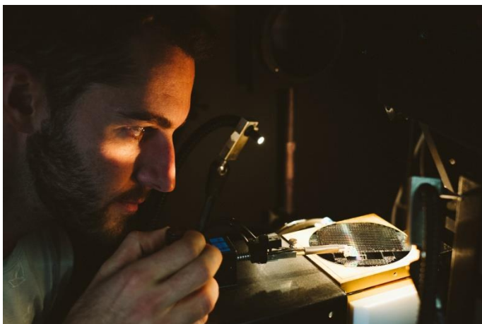
Tandemsolarzelle aus Silicium und III-V-Halbleitern ermöglicht eine deutlich bessere Ausnutzung des Sonnenspektrums als heutige Standardsolarzellen.

Das Projekt, in dessen Rahmen die Mehrfachsolarzelle auf Siliciumbasis entstand, wurde durch das Bundesministerium für Bildung und Forschung BMBF im Rahmen des Projekts MehrSi gefördert. Partner im Projekt waren die TU Ilmenau, die Philipps-Universität Marburg sowie der Anlagenhersteller AIXTRON SE.