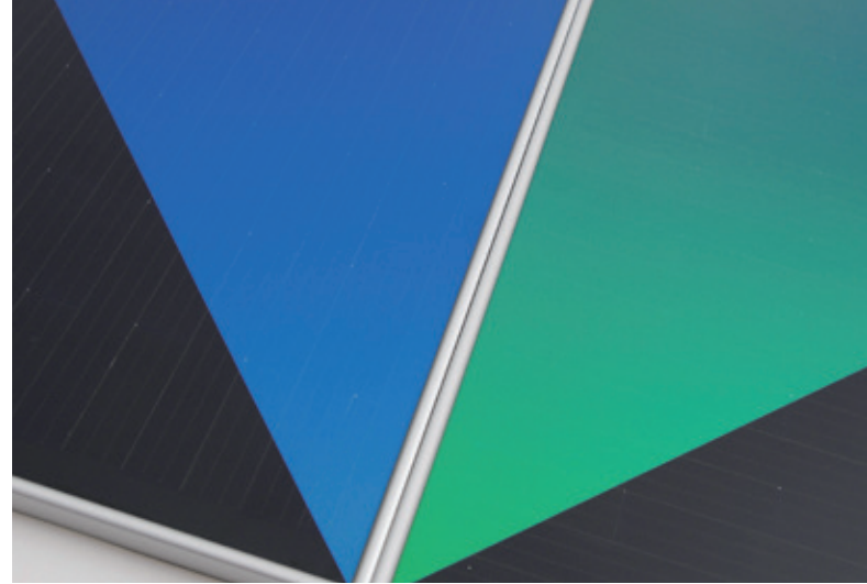
Die Matrix aus Schindelsolarzellen ist unter der Morpho-Color® Beschichtung nahezu unsichtbar.