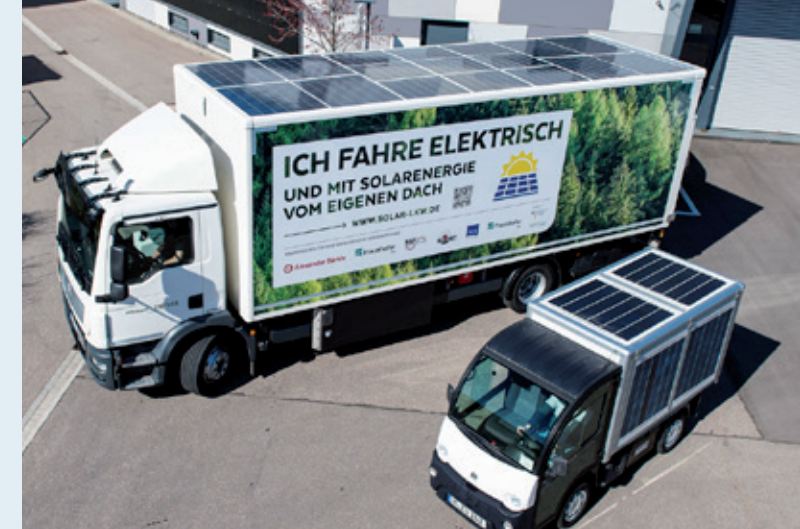
E-LKW und Mini-E-LKW mit Photovoltaikmodulen.

Eine Messkampagne des Fraunhofer ISE aus dem Jahre 2017 hat ergeben, dass ein typischer dieselpetriebener LKW-Auflieger mit 40 Tonnen in unseren Breitengraden zwischen 1500 und 2100 Liter Diesel jährlich durch integrierte PV-Module einsparen kann.