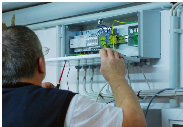
Abb. 1: Inbetriebnahme der Messtechnik einer Wärmepumpenanlage

Freiburg, 4. Dezember 2008 Nr. 35/08 Seite 4