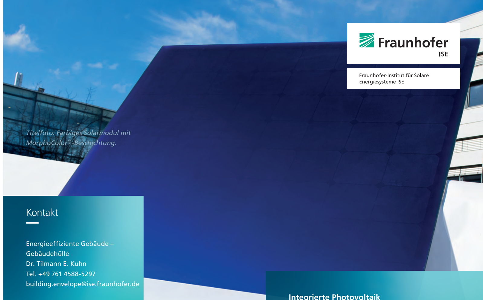
Titelfoto: Farbiges Solarmodul mit MorphoColor®-Beschichtung.

Gemeinsam mit Partnern aus der Industrie realisieren wir weitere Referenzprojekte. Im Module-TEC – Module Technology Evaluation Center fertigen wir Muster und Pilotchargen auf Industrieanlagen. In den nach DIN EN ISO IEC 17025 akkreditierten TestLabs »Solar Façades« und »PV Modules« prüfen wir die elektrischen, thermischen und optischen Eigenschaften der multifunktionalen Bauelemente sowie Qualität und Zuverlässigkeit der Module und Systeme.