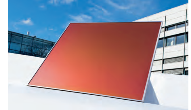
Farbige Solarmodul mit MorphoColor®-Beschichtung.

Farbige PV-Module können die Gebäudearchitektur beleben, interessant und modern wirken lassen. Gemeinsam mit Industriepartnern entwickelt das Fraunhofer ISE die Farbschichtung MorphoColor® zur Marktreife.